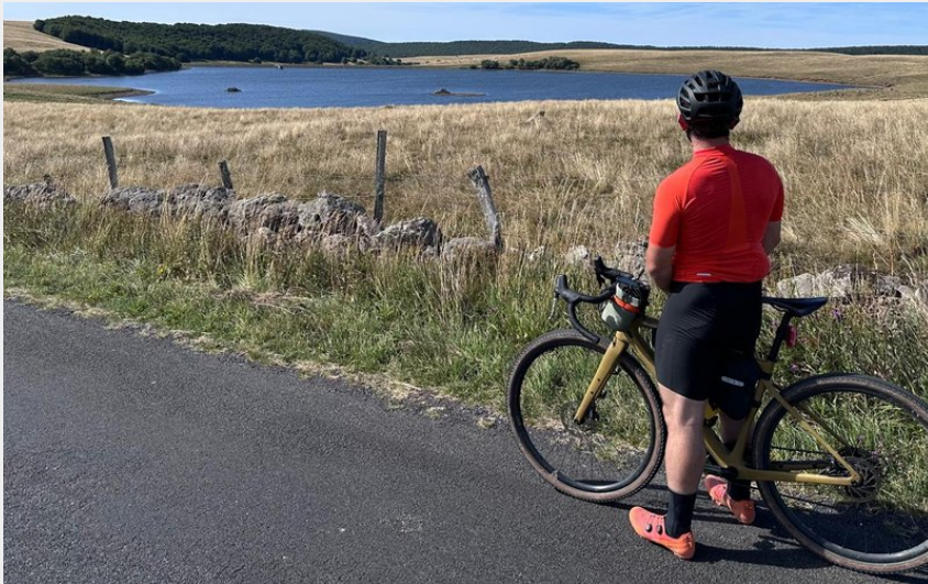
Lac des Moines