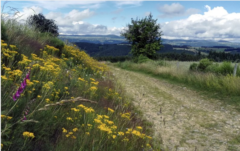
Sur les chemins de Margeride