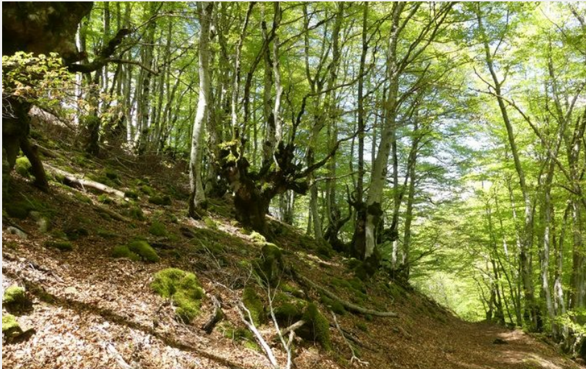
Forêt de hêtres (nathalie.thomas)