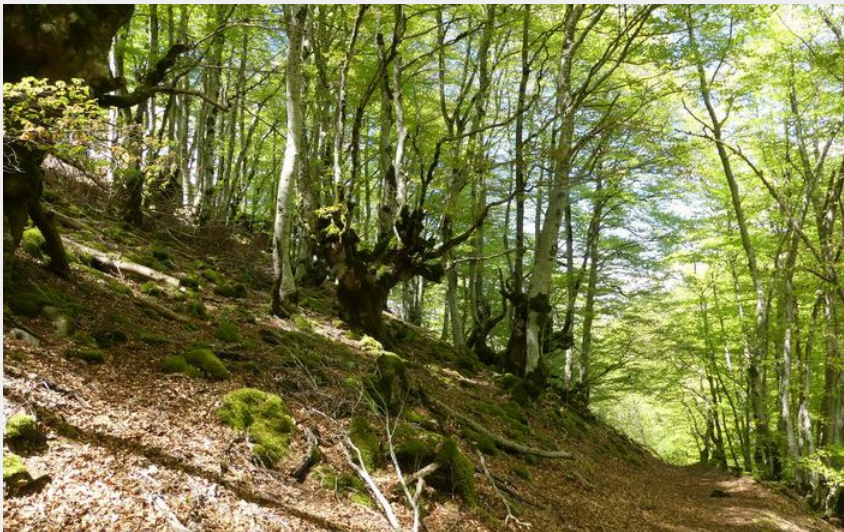
Forêt de hêtres (nathalie.thomas)