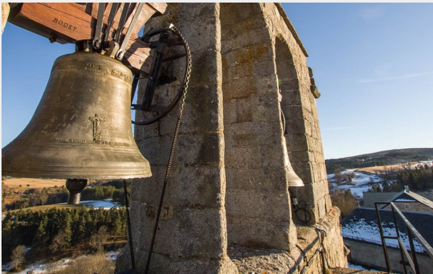
Clocher de l'église d'Albaret-Ste-Marie