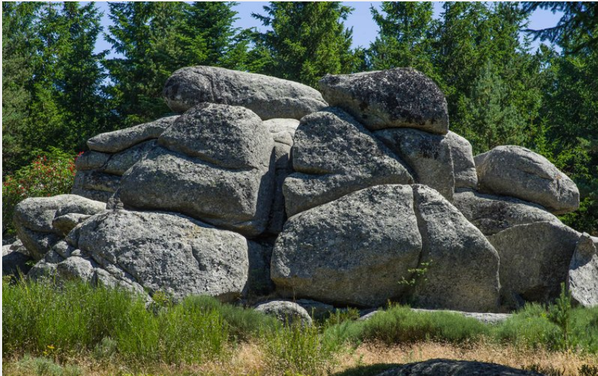
Chaos granitique