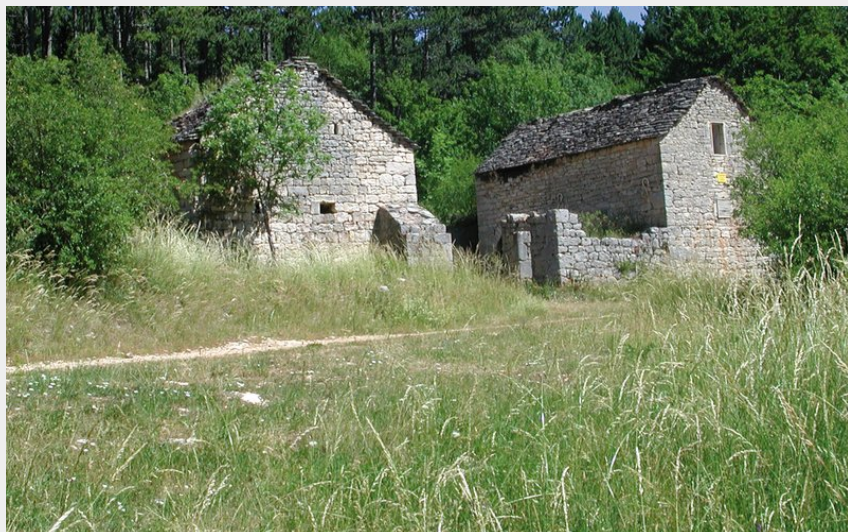
Village Mort du Gerbal sur le Causse de Mende