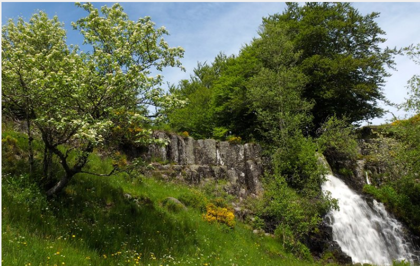
La cascade du Saltou