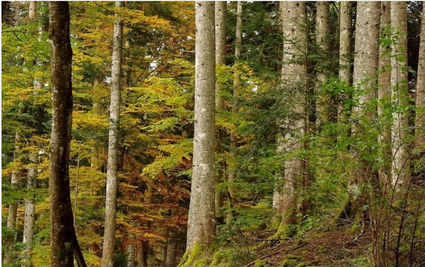
Forêt du Mont Lozère