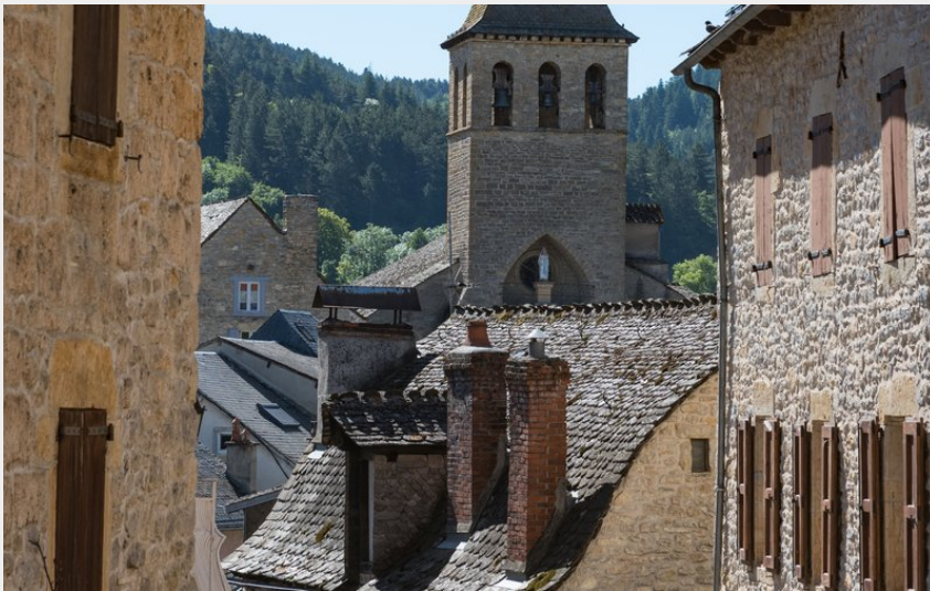
Rue de Chanac et son église (OTAGDT)