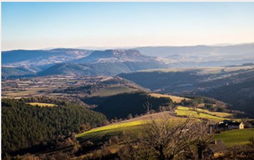
Sur les hauteurs de Marvejols