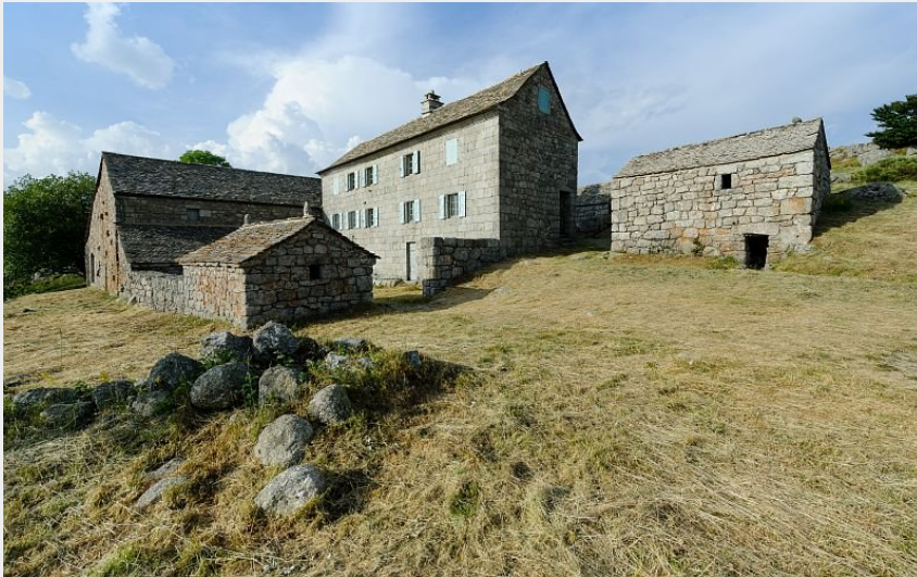
Mas Camargues