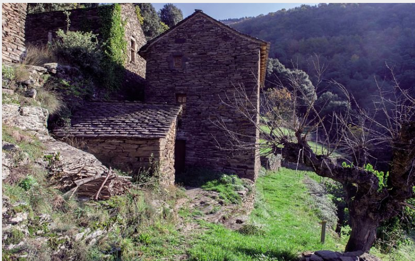
La Roquette (© Olivier Prohin)