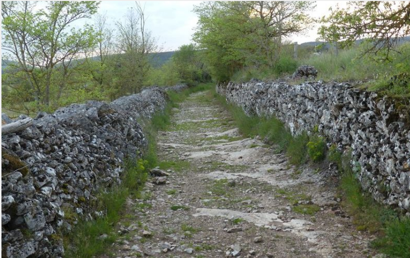
Chemin de Mas de val