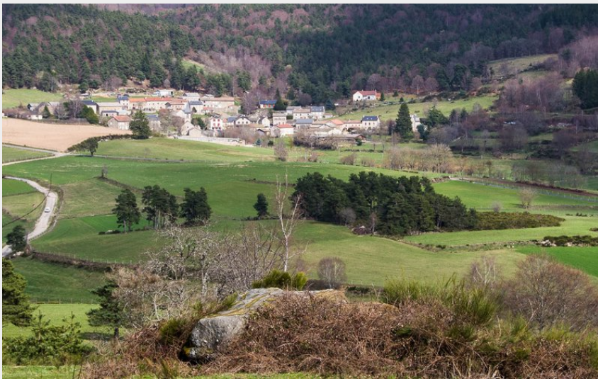
Hameau de Mialanes