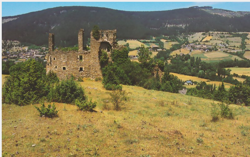
Ruines du château de Montialoux