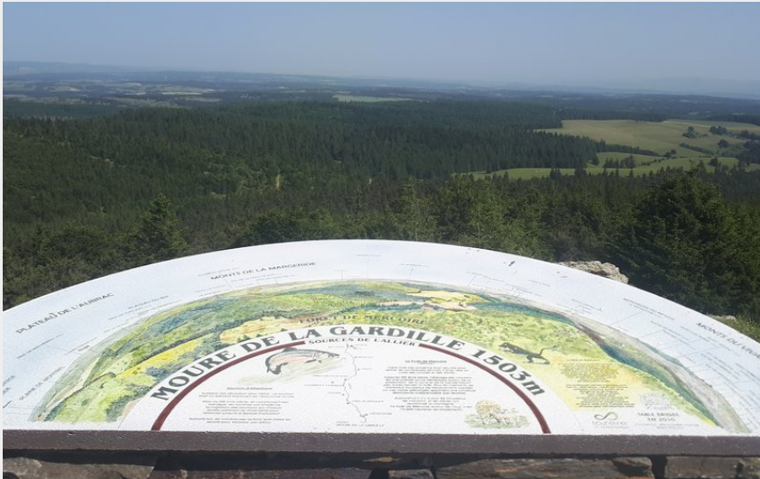
Table d'orientation du Moure de la Gardille, sommet de Lozère (TouN)