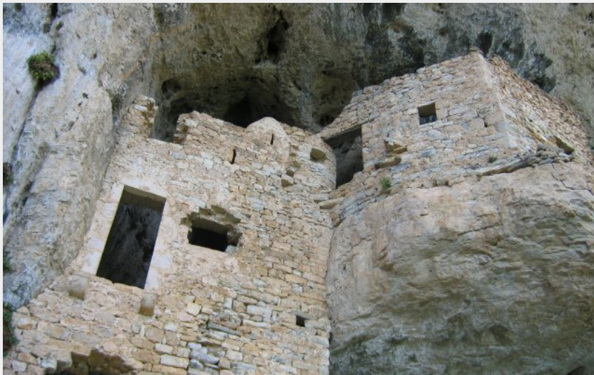
Habitation dans la roche à St Marcellin (OTAGDT)