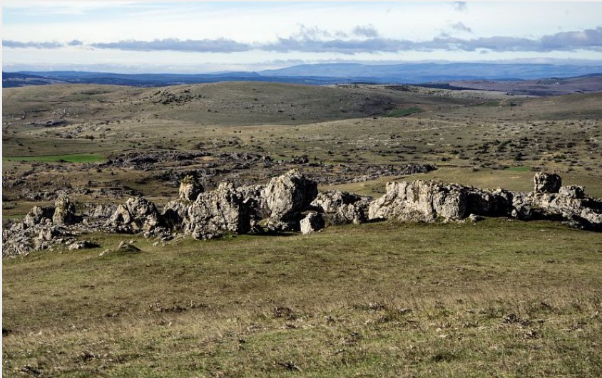
Paysage du causse Méjean à Galy