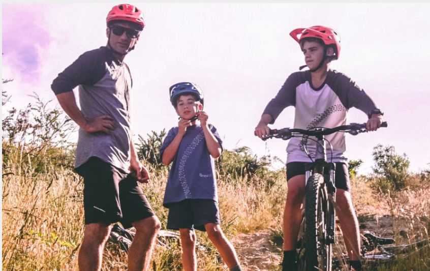
vtt famille