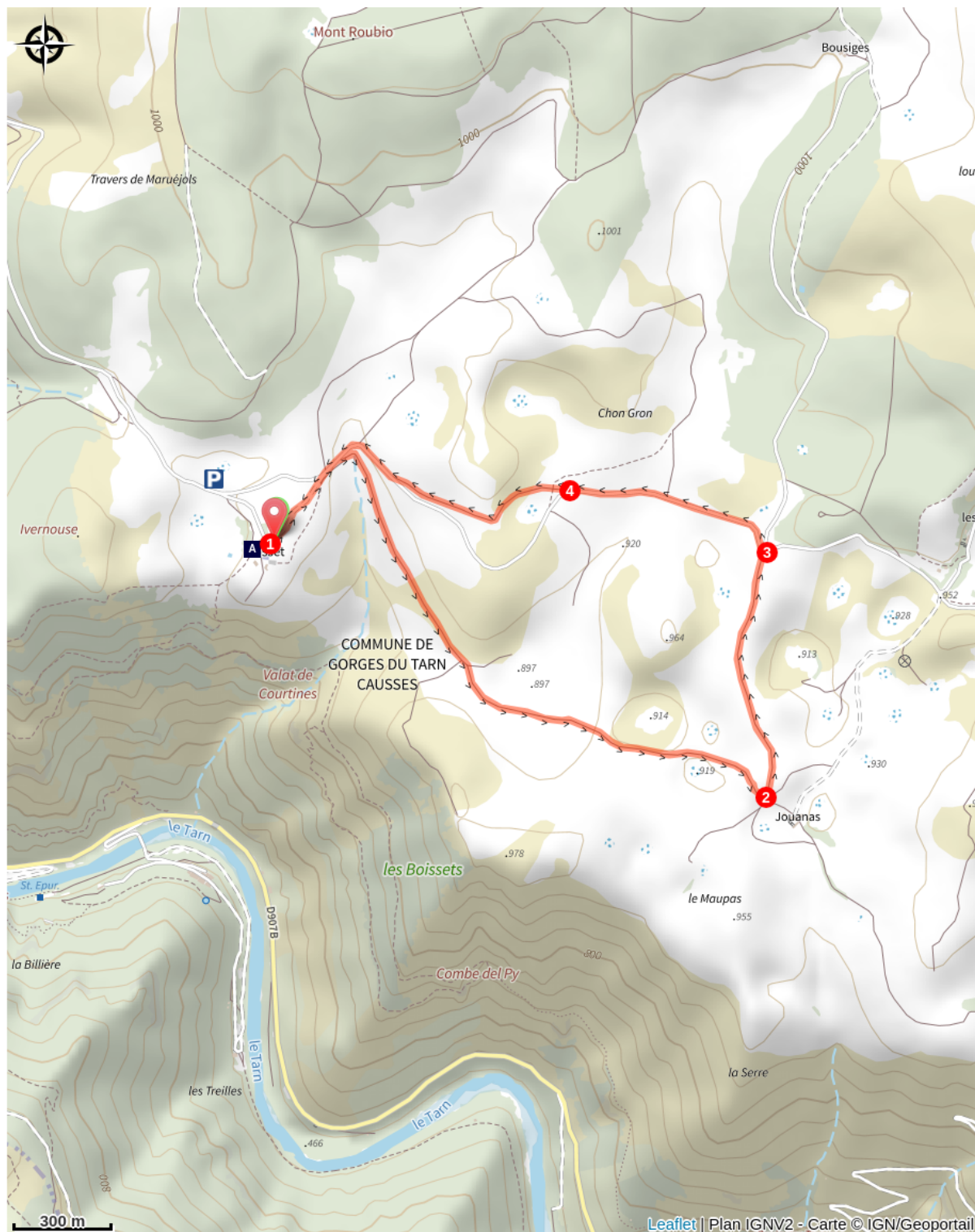
Domaine des Boissets (A)