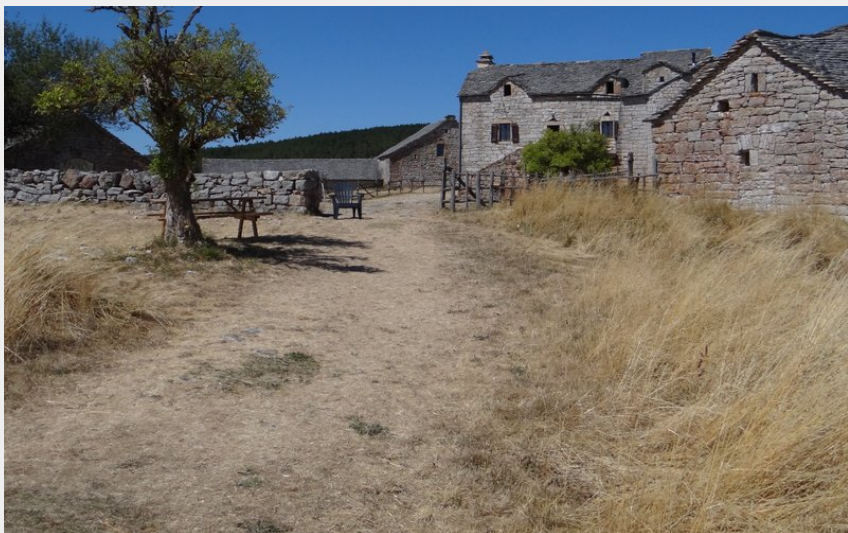
Domaine de Boissets