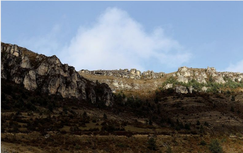
Falaises au-dessus de Salvinsac