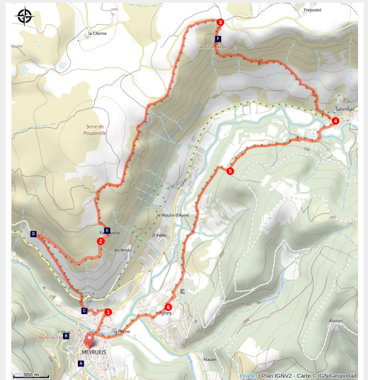
La Jonte à Meyrueis

Du plateau aride des causses au contrefort du puech Pouchut, cet itinéraire permet la découverte de la haute vallée de la Jonte, riche en contraste. Un voyage entre Causses et Cévennes.