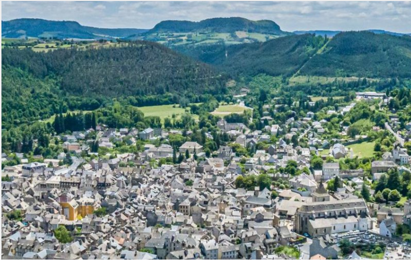
Marvejols vu d'en haut