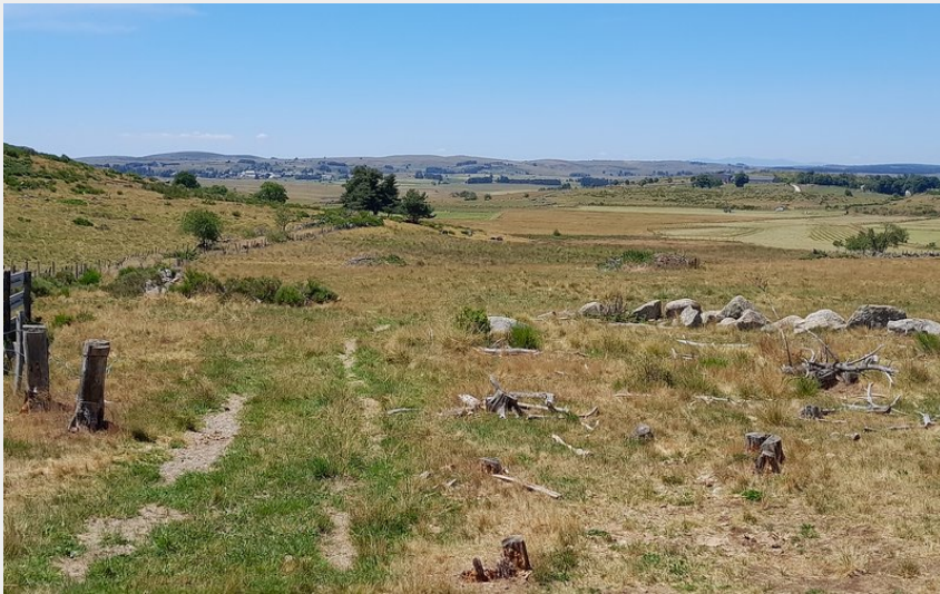
Panorama sur le plateau de l'Aubrac