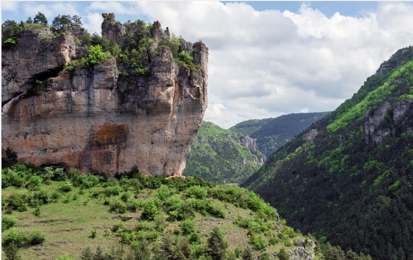
Roc de Saint-Gervais (Bruno Daversin)