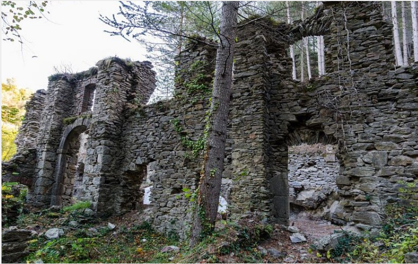
Usine du Bocard