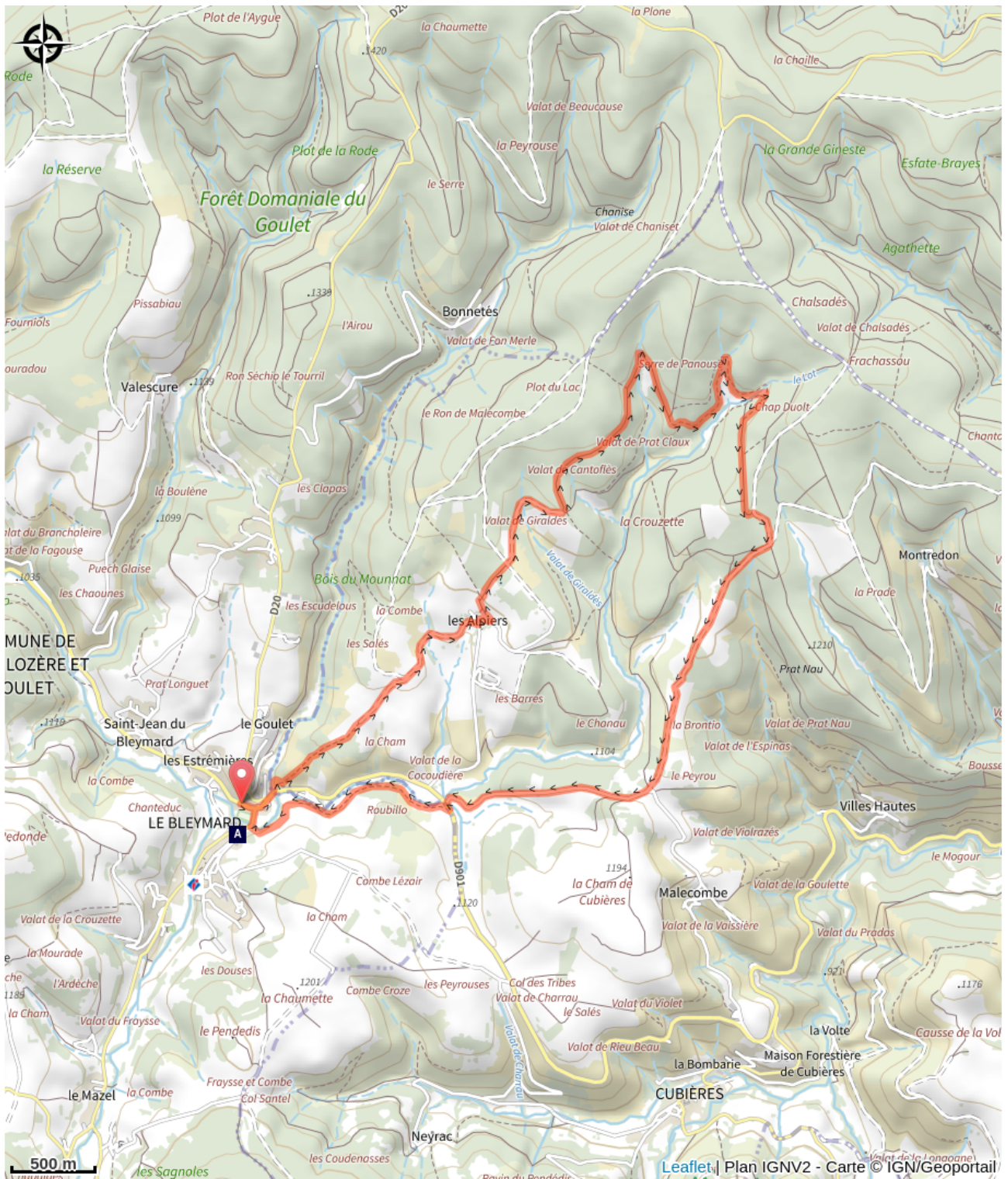
La croix des Missions (A)