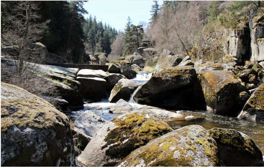
Baou de l'Estival (OT de l'Aubrac Lozérien)