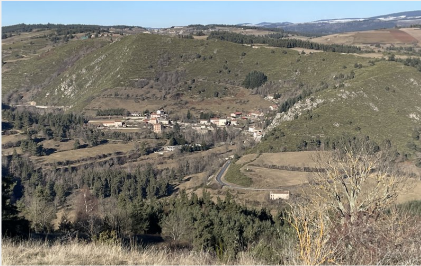
Vallée du Chapeauroux