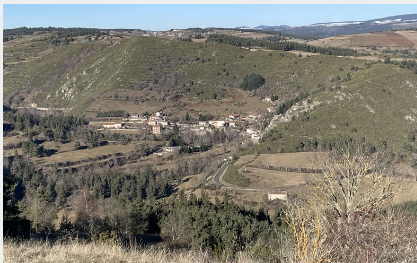
Vallée du Chapeauroux (CCHA)