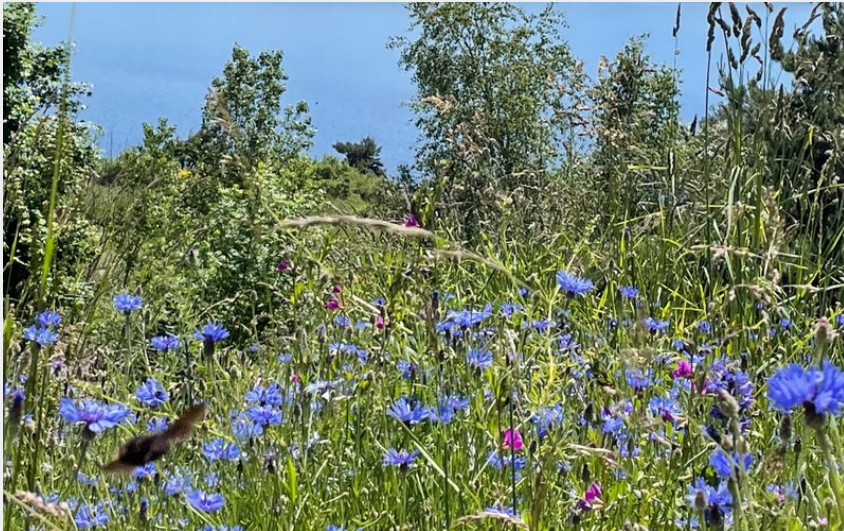
On surplombe le lac (CC Haut Allier Margeride)