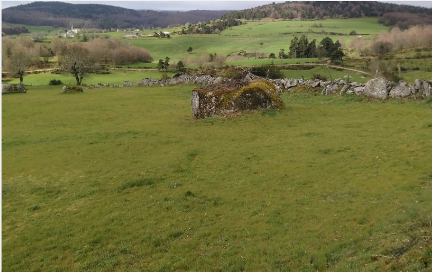
Pic de Mus et Saint-Laurent-de-Muret