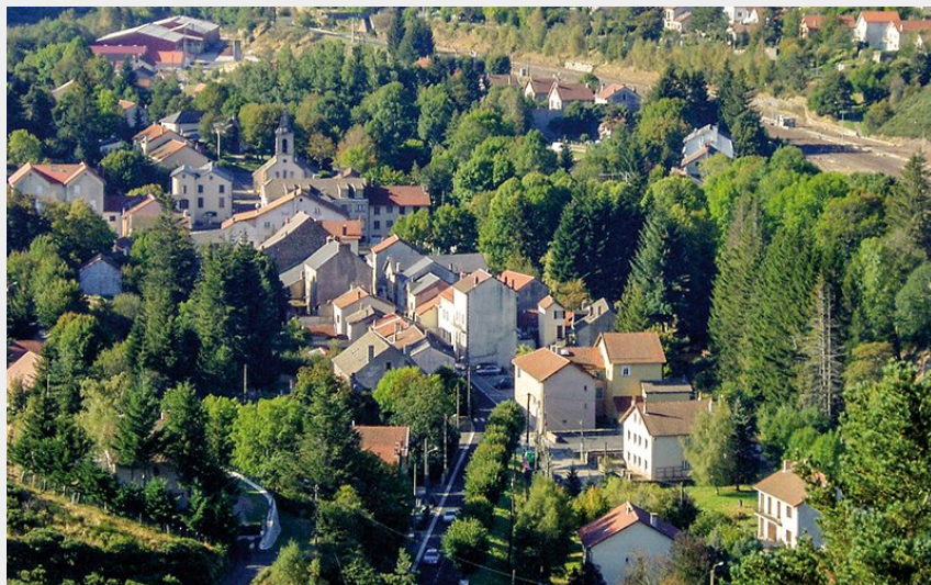
La Bastide-Puylaurent (©OT Mont Lozère)