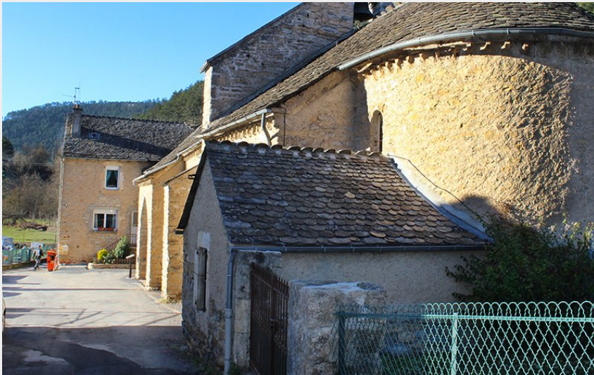
Eglise de Balsièges