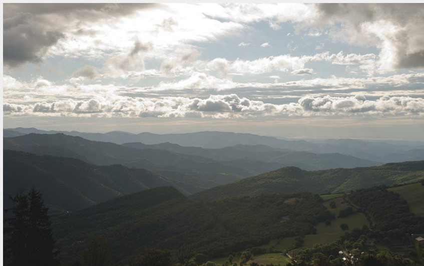
Le Pampidou et les corniches des Cévennes