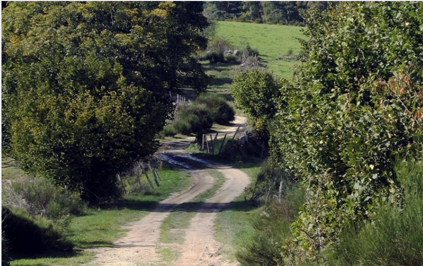
Au fil du chemin à travers prés et forêts