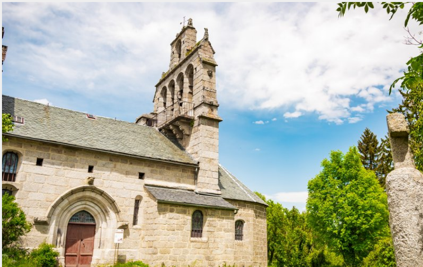
Eglise de Blavignac (Ludo Visuel)