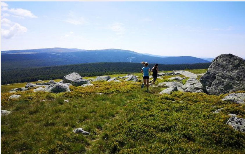
Coueurs sur les Crêtes du Mont Lozère