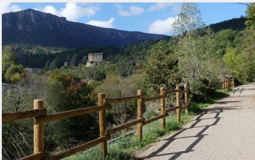
Château de Montvaillant